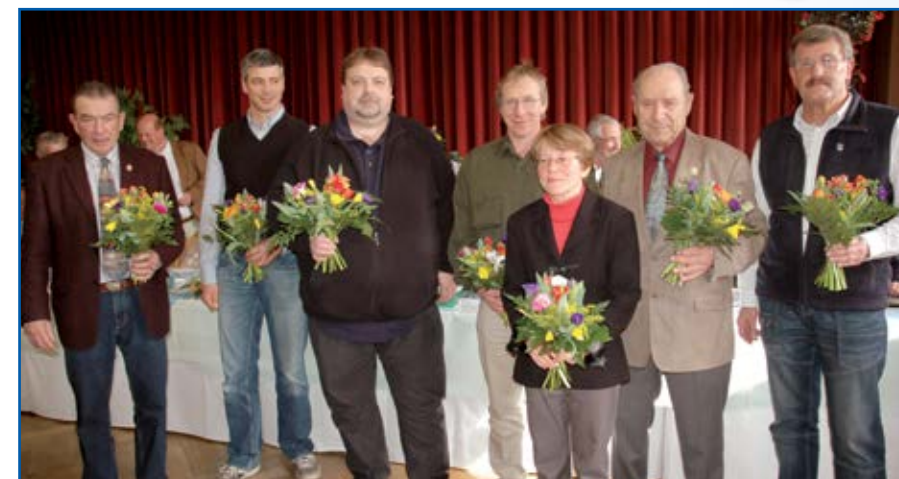
Ein Blumenstrauß als kleines Dankeschön an die fleißigen Helfer der diesjährigen Jahreshauptversammlung, welche maßgeblich für den reibungslosen Ablauf der Veranstaltung sorgten